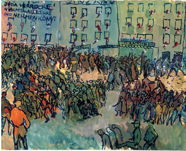
ליל הברדלח מאת שרלוטה סלומון, מתוך חיים? או תיאטרון? (Leben? oder Theater?), גואש על נייר, 1940-1942 לערך

הנאצים ביחס ליהודים הוצגו כאן במפורש באוזני אנשיהם, ובאופן מוסווה לכאורה בפני גורמי חוץ. הן הרחיבו את תחום מה שניתן להעלות על הדעת ומה שאפשר לומר. לנוכח הפרספקטיבות שסומנו נדמה היה, שהסתייגויות מאמצעים אנטי־יהודיים חריפים עוד יותר, כאלה שקודם לכן איש לא העלה כלל על הדעת, הן פשוט קטנוניות. אמירות אלה הגיעו לשיאן ב־30 בינואר 1939, כאשר התווה היטלר את העקרונות והמטרות של המדיניות האנטי־יהודית של המשטר בנאום ברייכסטאג. ראשית נתן לגיטימציה ל"אריזציה" של רכוש יהודי: