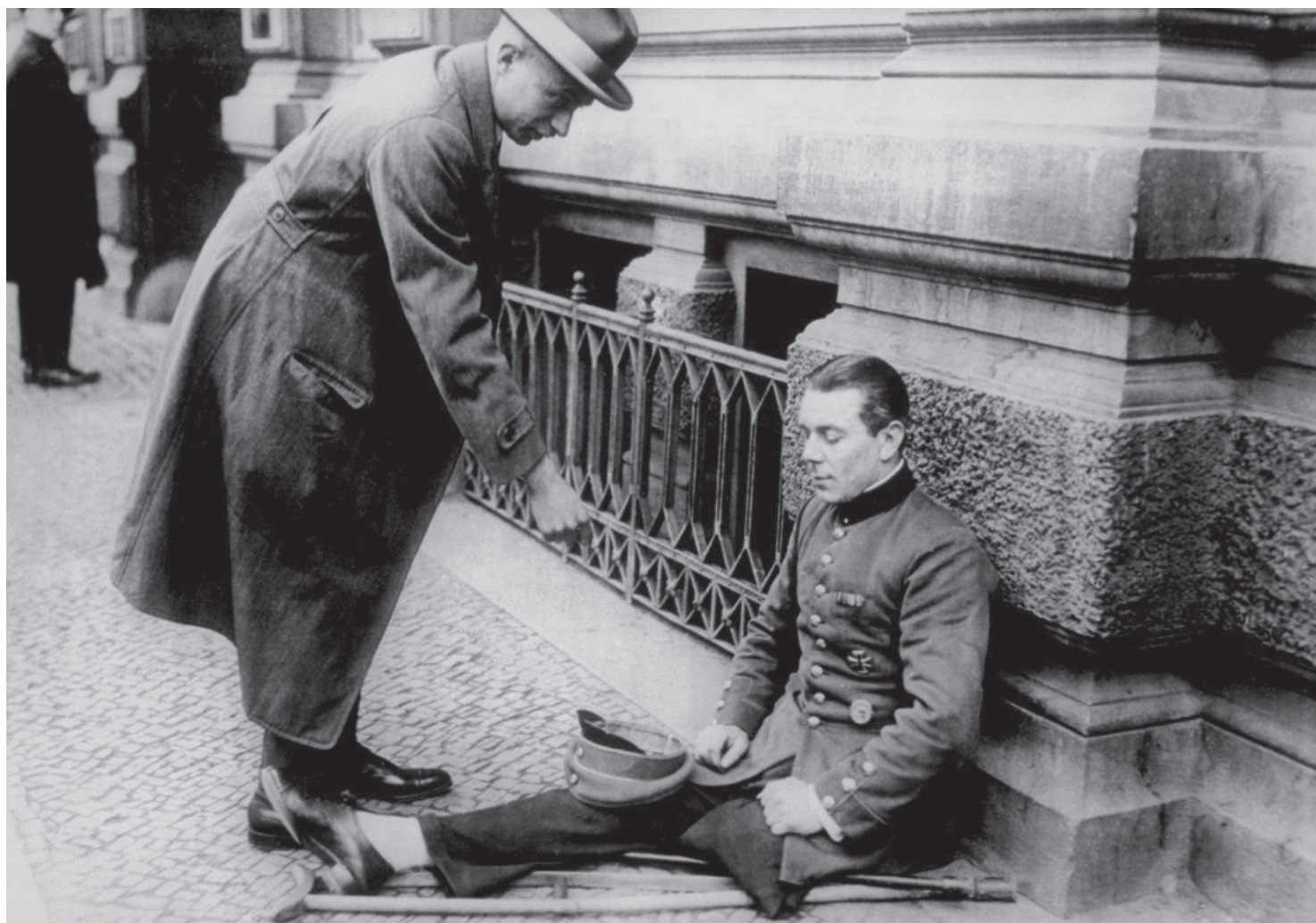
קצין לשעבר בצבא הגרמני מקבץ נדבות, 1923 לערך

למסורת ולמנהגים, מוצא את דרכו בעולם החדש ויוצא נשכר מהמודרניות, זוהה כיהודי – גם על ידי אנשים כתומס מאן, שמאוחר יותר נחשבו למשקיפים מפוכחים. מאן אפיין את הספסר הטיפוסי כ"יהודי-בלונדיני ואלגנטי, באמצע שנות השלושים לחייו, מרכיב משקפי מצבט, ידיו לבנות, שמנמנות ומטופחות, לבוש מעיל בית ונעלי בית מבהיקות – טיפוס מובהק של ספסרי התרבות הקפיטליסטית הבינלאומית". 11 נוסף על הפיחות במטבע העצימה חוויית האינפלציה את חוסר האמון בליברליזם ובקפיטליזם ואת הטינה כלפיהם בכלל. עם זאת, בניגוד לאנטישמיות, שסיפקה הסבר ואמצעי פורקן לימין שהגדיר את עצמו באמצעותה, אנטי-קפיטליזם עממי, שהתבסס כתוצאה מהאינפלציה, היה נפוץ גם בשמאל ואף במרכז. ההתנסויות של תחילת שנות העשרים רופפו אפוא את הזיקות האינטלקטואליות