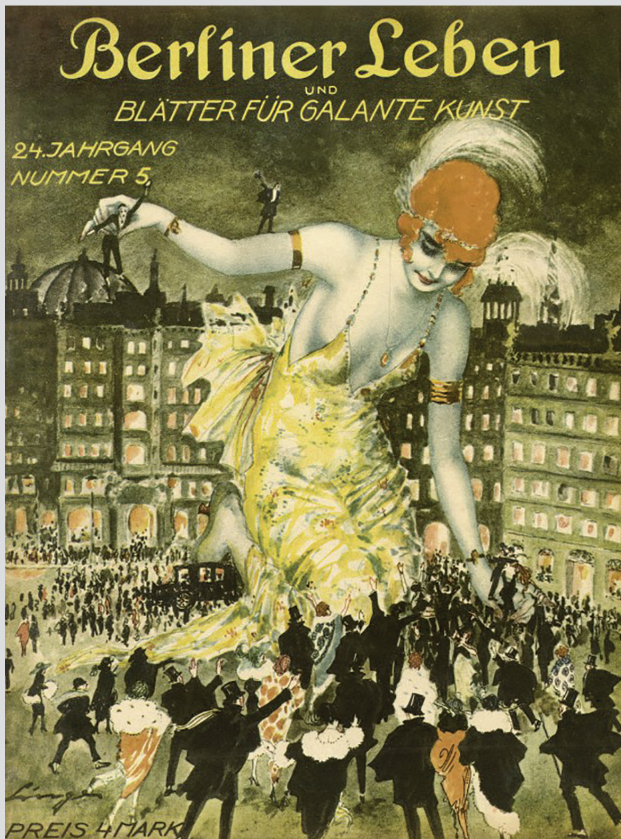
שער כתב העת המאוריר Berliner Leben ("חיים בנוסח ברלין"), 1921. כתבי העת המאורירים שנופצו החל משנות העשרים הפיצו דימויי עירוניות מודרנית וסגנונות חיים חדשים.