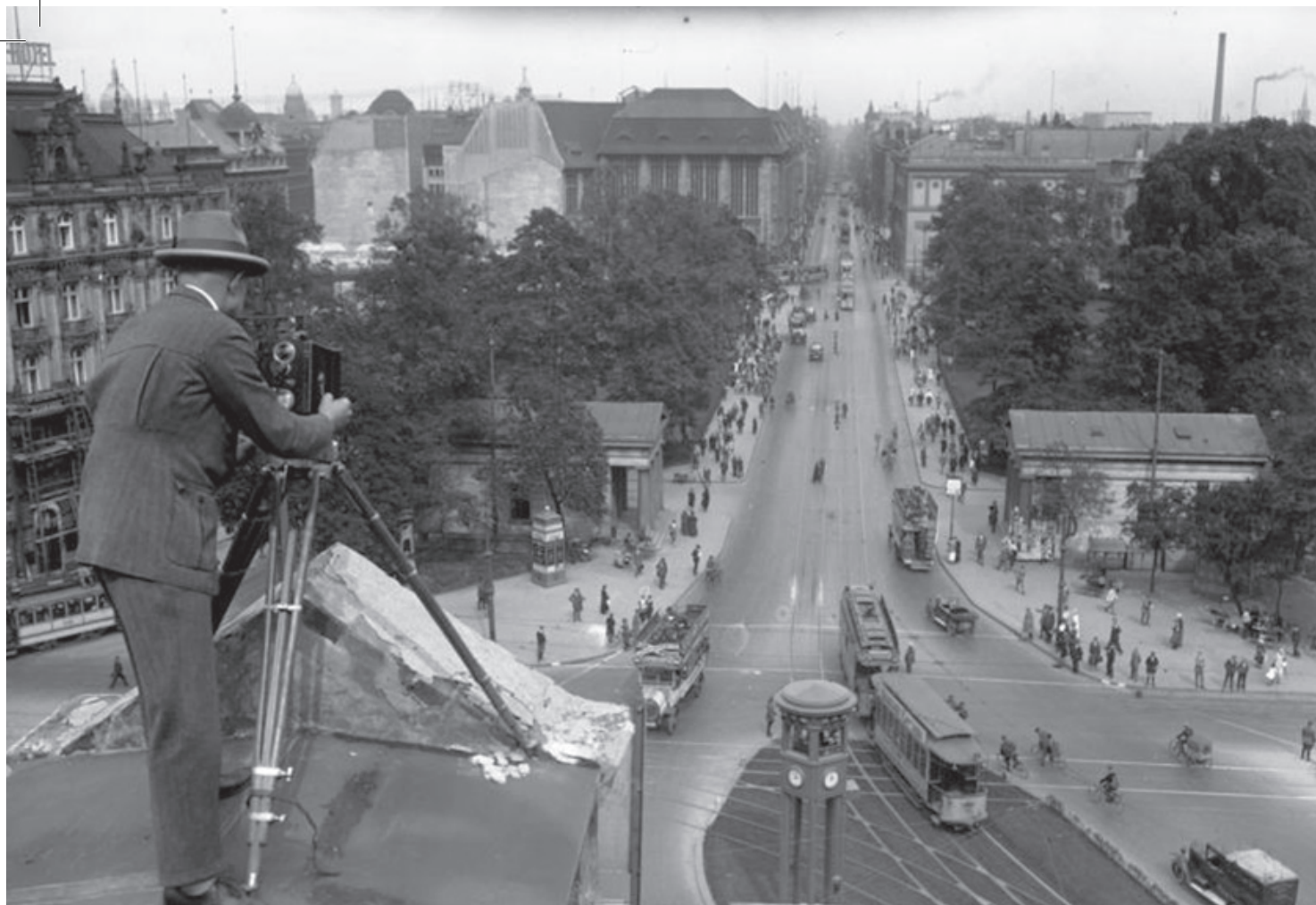
מבט על כיכר פוטסדאם ורחוב לייפציג, ברלין, שנות העשרים של המאה העשרים

שלהם ביחס לטוב ולרע, למכובד ולנתעב". כך התקמו היהודים בתחומים האופייניים ביותר של העידן המודרני: "פובליציסטיקה, תיאטרון, עיתונות" וכן "משפטים, אקדמיה ורפואה". לפיכך, מבחינה משפטית יש לנהוג בכל יהודי גרמניה – שיהדותם נקבעת לפי מוצאם ולא לפי השתייכותם הדתית – כבאזרחים זרים, לחייב אותם לשלם מס כפול ולמנוע הגירה יהודית נוספת. יש למנוע מיהודים לכהן בתפקידים ציבוריים, לאסור עליהם לשרת בצבא ולחסום בפניהם מקצועות כגון הוראה, עריכת דין וניהול תיאטרונים. גם זכות ההצבעה תילקח מהם. 6